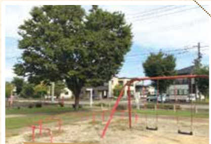
公園樹として利用されるケヤキ

また、「材」としても、とても有用で、木目や色がとても美しく、 硬すぎず、柔らかすぎないため、寺社の建築材として使われたり、