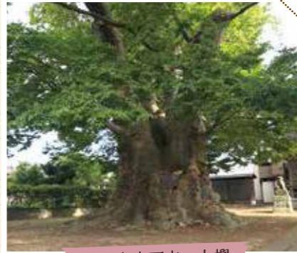
長岡市古正寺の大榲

さて、ケヤキを見る ことができる一番身 近な所としては、道 路の緑陰確保や、 景観向上のために 植えられている「街 路樹」ではないで