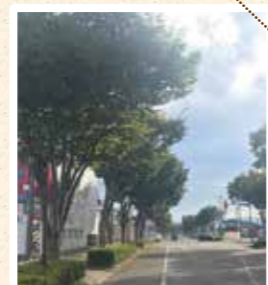
街路樹として利用されるケヤキ