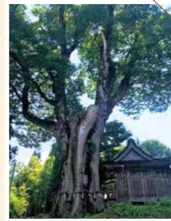
十日町市赤谷十二社の大けやき

次は、十日町市赤谷にあります「赤谷十二神社の大ケヤ キ」を紹介します。昭和33年3月5日に新潟県指定文化財 天然記念物に指定されました。木の周囲は、約10m、高 さは約46mあり、樹齢1200年と言われています。このケヤキ は、初代征夷大将軍、坂上田村麻呂が、東への遠征の際 に植えたとされています。その後、江戸時代には神木とさ れ、幾多あった合戦のつど、兵士たちを守ったとされてい ます。明治以降は、出兵の 際には、このケヤキの樹 皮を身につけて戦地に赴 いたそうです。