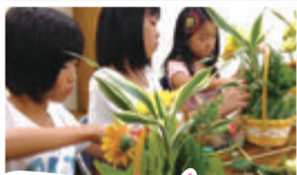
水原おとぎクラブ 小学生フラワーアレンジメント

学校や保育園・幼稚園、公民館、町内会、地域団体などが新潟県内で樹木やガーデニング、自然に関する講習会等を開催する際に、当センターに登録されているアドバイザーの中から活動に合う講師を派遣し、講師への謝金や交通費を助成するものです。年2回までご利用いただけます。当センターのホームページにアドバイザーリストも掲載しています。講師をお探しの方はぜひご相談ください。