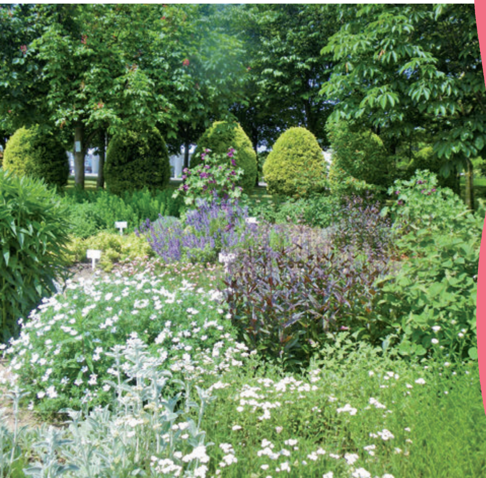
新潟県スポーツ公園のハーブ花壇 公園サポーターのみなさんと一緒に手入れが行われています

新潟県都市緑花センターは、本誌グリーンスケッチやイベント等を通じて、花や緑を取り入れたうるおいある暮らしを提案しています。今回は、地域の公園の花や緑に関わっているみなさんのボランティア活動をご紹介します。