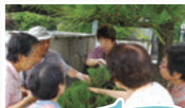
関屋小学校区コミュニティ協議会 大人のチャレンジゼミ松の手入れ