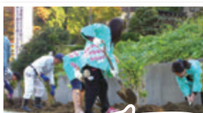
湯田上温泉旅館協同組合(田上町) アジサイ50株を助成

県管理施設や小中学校で地域の住民やボランティア団体が花や緑に関する活動を行う場合(助成対象経費が単年度10万円以上の活動に限る)、50万円を上限に当センターが樹木や草花などの材料費を助成するものです。