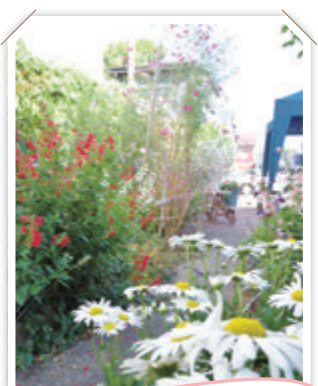
上越オープンガーデン愛好会 会員の庭を訪ねて(53号)

新潟県都市緑花センターが管理を行う県立都市公園には、ボランティアやサポーターとして花・緑に関わっている方々がいらつやいます。「植物が好き」「外で体を動かすのが好き」「地域に貢献したい」など参加のきっかけは異なりますが、そんなみなさんの活動によって、四季折々の美しい花壇が保たれ、また、数多くの楽しいイベントの開催が可能となり、それらが公園の魅力アップにつながっています。