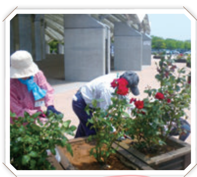
バラの手入れ (新潟県スポーツ公園サポーター)