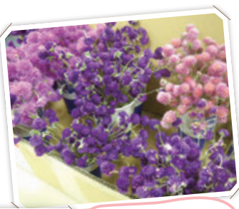
クラフト教室の 材料準備 (新潟県スポーツ公園) サポーター