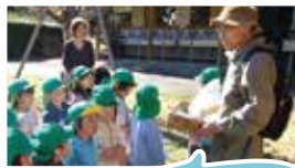
三条市なでしこ青空保育園 木の実・落ち葉あそび