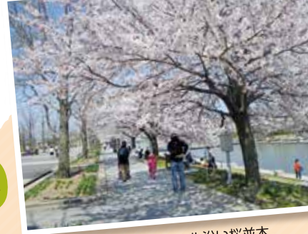
スポーツ公園カナル沿い桜並木