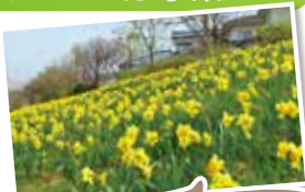
新津川水仙物語(新潟市秋葉区)スイセン球根 3年間のべ44,000球を助成

県管理施設や小中学校で地域の住民やボランティア団体が花や緑に関する活動(助成対象経費が単年度10万円以上の活動に限る)を行う場合、50万円を上限に当センターが樹木や草花などの材料費を助成するものです。