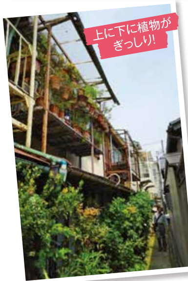
上に下に植物が ぎっしり!