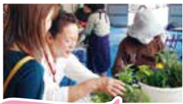
新発田市加治川地区公民館 やさしいガーデニング教室

学校や保育園・幼稚園、公民館、町内会、地域団体などが新潟県内で樹木やガーデニング、自然環境に関する講習会や講演会を開催する際に、当センターのアドバイザーの中から活動内容に合う講師を派遣し、講師への謝金や交通費を助成するものです。年2回までご利用いただけます。当センターのホームページにアドバイザーリストも掲載していますので、講師をお探しの方はぜひご相談ください。