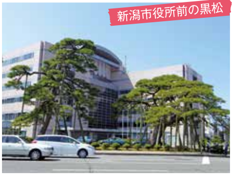
新潟市役所前の黒松

の黒松はそれらの変遷をずっと見守ってきました。これらの植物がなぜこの場所にこの姿で佇んでいるのか。ふとその疑問に足を止めたとき、私たちは植物を通して、かつてのまちの姿、まちの記憶を感じることが出来ます。