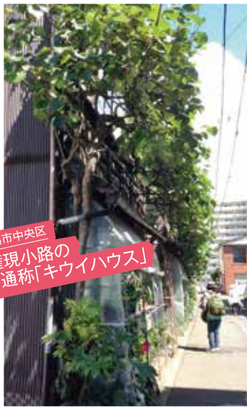
新潟市中央区 権現小路の 通称「キウイハウス」

上下左右に視線を移し、時にしゃがんだり背伸びしたり。いつもと視点やテーマを変えて歩けば、新たな発見がたくさん。見慣れた日常風景がきらきらと輝き出します。