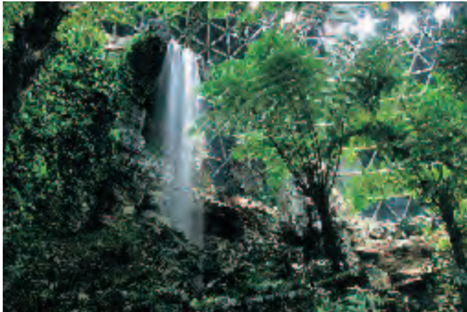
表紙写真／第1回新潟県立植物園写真コンテスト 【温室部門】県知事賞作品 「熱帯植物ドーム夜景Ⅲ」 大橋新三郎