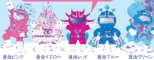
食虫ピンク 食虫イエロー 食虫レッド 食虫ブルー 食虫グリーン