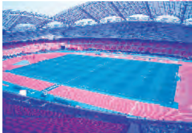
* IAAF (国際陸上連盟) が定める基準。 世界でも23ヵ国26箇所が認証登録されている (2004年5月現在)。

アルビレックスの活躍とともに、全国にその名をとどろかす新潟スタジアム「ビッグスワン」。 迫力ある外観とともに、陸上トラックは日本初のIAAF CLASS1認証トラック*であり、美しく保たれた天然芝のフィールド。日本有数の規模、機能を兼ね備えた、まさに新潟の誇りです。 そんな新潟スタジアムの緑であり、さまざまな感動のステージである「フィールドの芝」にちょっと迫ってみたいと思います。 芝にとって厳しい夏の高温多湿。 この季節、芝を健康に維持するためにどんなことが行われているのでしょうか？