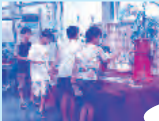
食虫植物 体験コーナー

観察や体験を通して、楽しみながら植物の不思議な一面を学ぶことができる、夏休みとおきの企画展示にぜひ足をお運びください。