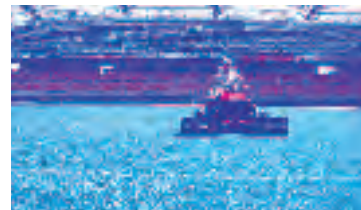
刈込状況 フィールドのしま模様も刈込時につくっているもの。芝を押しながらかいているため、芝の寝ている向きによって濃淡に見えます。

シーズン中の刈込は週に2~3回。25mmの高さに維持しているスタジアムの芝ですが、生育期には1日に5mmも生長します。長く伸ばしてから刈ることは芝へのダメージが大きく、質も落ちてしまいます。また、高温多湿を好む病原菌がはびこるのを防ぐためにも、こまめな刈込が必要なのです。