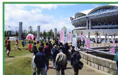
▲NIIGATAスプリングフェスティバルの様子。4月、新潟県都市緑花フェアと併催されています。