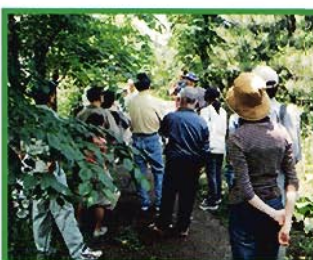
▲スポーツ公園内での自然観察会(ながたの森活動会)

スポーツ公園の東側園地の計画ワークショップ参加。公園完成後も「ながたの森活動会」として維持管理などを行う。自宅も鳥屋野湯公園に程近く、プライベートでも多く利用している。