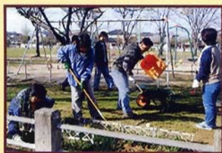
▲活動の様子(草取り)

して遊んだりしているのを見ると、きれいにしておかなければならないなあ、と思います。また、子どもたちが自由に安全に遊べるように、見ている大人たちが声をかける、声がけ運動も行っています。