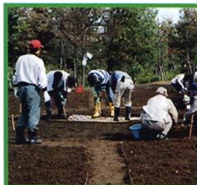
▲チューリップの球根植え付け(ながたの森活動会)

域の各家庭で孵化させまして、今日それを半分くらい放しました。私自身は、15年前に越してきたのですが、整備のときからこの公園を見守ってきて、家族でも利用しました。多目的広場があって、子供たち、家族でサッカーもできるし、ボールも投げられます。それと自然。新潟もほとんど都市化されていますけども、ここに来れば自然に触れ合えることができます。子供たちも、遊びの中でいろいろなもの学んだと思っています。