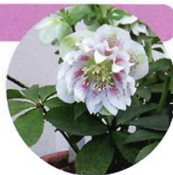
▲クリスマスローズの交配種

庭植えの植えつけ適期は秋。水はけがよいことと、冬から春に日当たりがよく、夏でできるだけ涼しい場所が適しています。根が深いので深く耕します。6月から9月に日陰にならない場所では、日光をさえぎる『寒冷紗』の設置が必要です。冬は土の凍結を避けるため、ワラなどで株もとを覆います。