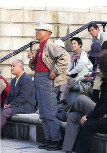
会場のみならずにもご意見をいただきました。