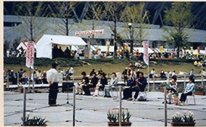
新潟県都市緑花フェアでの表彰式

平成12年度のチューリップの植付けには、新潟市内の山潟小学校、桜が丘小学校、曾野木小学校、鳥屋野小学校、上所小学校の5校と、県内の農業高校である、村上桜ヶ丘高校、新発田農業高校、巻農業高校、興農館高校、加茂農林高校、長岡農業高校の6校が参加し植付けを行っています。なお、農業高校については、デザイン等の技術の向上にもつながることを目的にコンテスト形式をとり、デザイン賞、カラーハーモニー賞、アイデア賞の3賞を設け審査を行い、デザイン賞は村上桜ヶ丘高校と加茂農林高校の2校。カラーハーモニー賞には、興農館高校と長岡農業高校の2校。アイデア賞については、新発田農業高校と巻農業高校の2校と決定し平成13年4月29日の新潟県都市緑花フェアにおいて表彰を行いました。また、「にいがた「緑」の百年物語」のスタートの年と