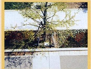
加茂農林高校 デザイン賞 日の出と日の入 粟ヶ岳から登る朝日と日本海に沈む夕日をイメージして作成しました。