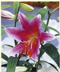
品種改良により色形は様々 (オリエンタルハイブリッド)

ハイブリッドがよく知られています。アジアティップハイブリッドはエソスカシユリ、イワトユリ、オニユリ、ヒメユリなどアジア原産のユリを交配したもので、花を咲かせる向きは横、上、下の3タイプがあり、花の色は様々で、香りが少ないのが特徴です。オリエンタルハイブリッドはヤマユリ、カノコユリ、ササユリ、オトメユリなどの日本原産のユリを交配したもので、草丈が1m以上と高く、花が大きく、香りがあり家庭栽培に向いています。