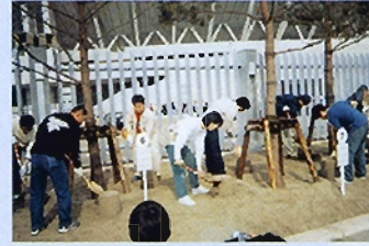
緑のプチオーナー記念植樹

緑のプチオーナーとは、2000年（平成12年）4月2日から2001年（平成13年）1月31日までに生まれた子供を持つ家族の方で当日は、171の家族が参加しました。