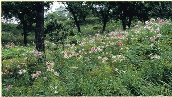
下田村(ヒメサユリ)

花が大きいために風に「揺り」動く、が語源とも言われているユリ。初夏の山野を華麗に彩るユリは、世界中の人々に愛されてきました。県内でも粟島や山北町笹川流れのイワユリや下田村のヒメサユリ、堀之内町「花ぎ公園」のスカシユリなど様々な場所で見ることが出来ます。また新潟県では五泉市や巻町、堀之内町などでユリの球根栽培も行なわれており、チューリップに次いで生産が盛んになっています。