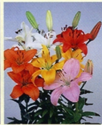
スカシユリ (アジアティップハイブリッド)