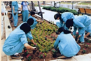
花苗植付けの様子 (H13.5.)

このカナル大通りの花壇が、小・中・高等学校及びボランティア団体等からの参加協力を得て、毎年美しい花でいっぱいになり、人々の目を楽しませ、心ませてくださいることを期待しています。