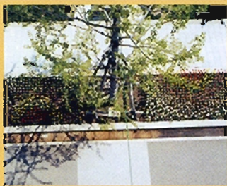
長岡農業高校 カラーハーモニー賞 虹 自然豊かな新潟県の春、チューリップ畑の空や日本海にかかる虹をイメージしました。