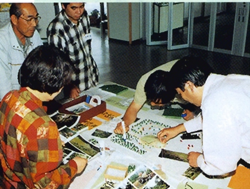
ワークショップによる公園の計画

今回開園したところは、百年かけて森をつくることを目標にしており、苗木をたくさん植えてあります。苗木が生長し、だんだん森らしくなる様子も楽しみにしてください。公園駐車場からは、一番遠いエリアになります。ぜひ足をのびして遊びに来てください。