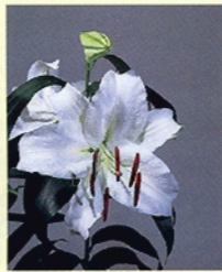
人気品種のカサブランカ (オリエンタルハイブリッド)