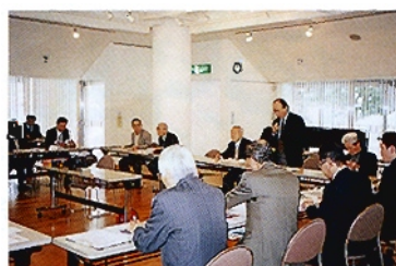
新発田市での情報交換会