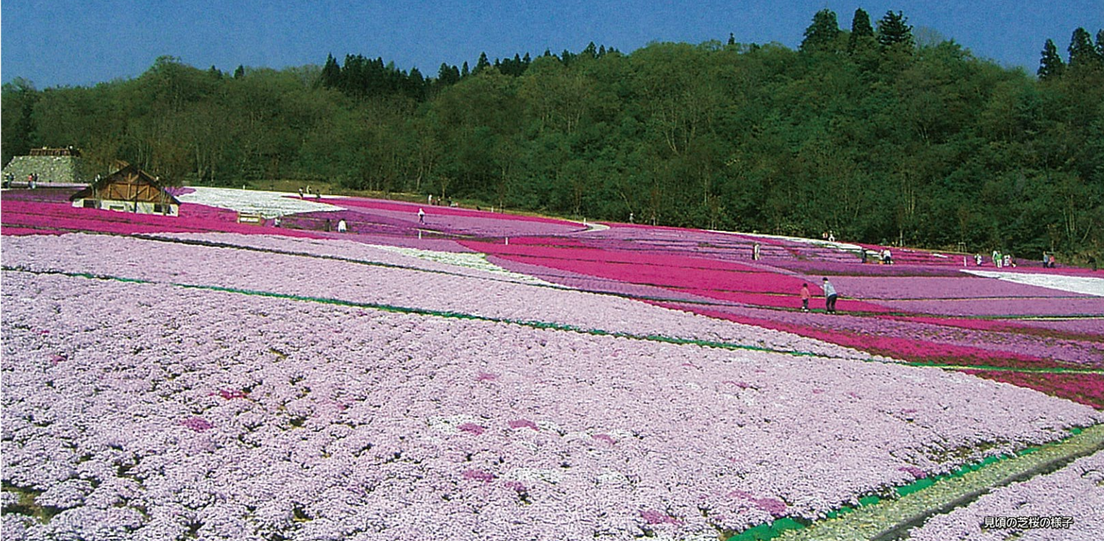
見頃の芝桜の様子