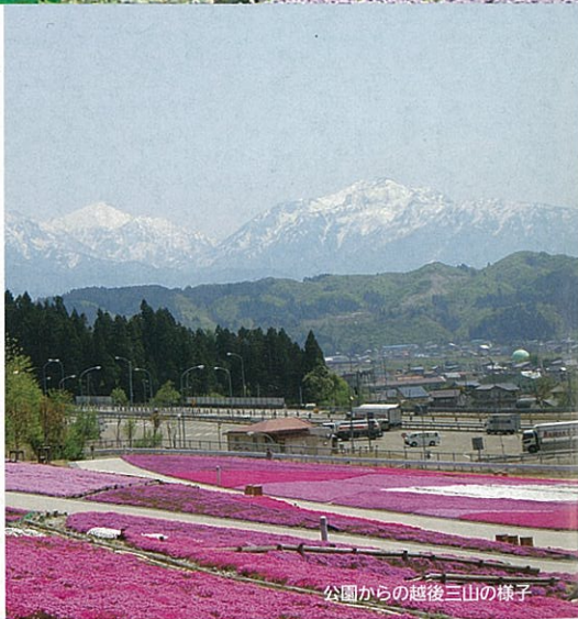
公園からの越後三山の様子

今回ご紹介する場所は、県立都市公園の奥只見レクリエーション都市公園にあります。奥只見レクリエーション都市公園は、魚沼市、南魚沼市の面積1070平方キロメートルに及ぶ雄大な自然資源に恵まれた奥只見地域をレクリエーション地域として開発・整備された公園です。浅草岳地域、大湯地域、須原地域、小出地域、浦佐地域、道光・根小屋地域の6つの地域で構成されています。そのうちの約6.9haの道光・根小屋地域は「根小屋花と緑と雪の里」と呼ばれ、魚沼の里山公園の創出をテーマに住民参加型の公園づくりを進めています。この地域に平成21年4月26日、芝桜広場が新たに開園しました。緩やかな斜面に、面積約1ha、約16万株のシバザクラが白やピンクの濃淡で一面を彩りました。広い園路が設けられ、シバザクラを觀賞しながら散策を楽しめます。昨年は4月末から5月上旬にかけて満開となり、魚沼地域に春の訪れを感じさせてくれる色鮮やかさでした。 このほか園内では、春のブナの新緑やミツバツツジ、レンゲツツジ、ヤマツツジが咲き誇ります。夏のトンボ池では日本一小さなハッチョウトンボが現れます。秋には赤や黄色に染まった紅葉がみられます。また、公園の頂上からは、魚野川を中心に魚沼市の市内が一望でき、ここから見る越後三山は素晴らしい風景です。 この春はぜひ満開のシバザクラを見にお出かけください。